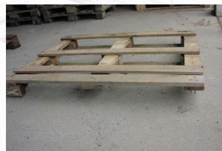
Chybějící laty a hranoly

Prodávající po kontrole dovezených i svezených palet a případném zjištění poškozených nebo špatně uložených palet o této skutečnosti informuje zákazníka. Zákazník je oprávněn poškozené nebo atypické palety odvézt na vlastní náklady do 14 dnů.