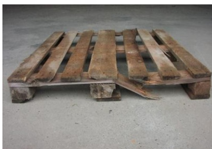
Příčně polámaná paleta